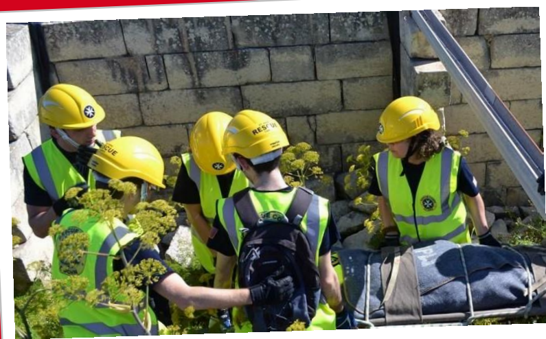
St. John's Rescue Corps

Insel im Schnittpunkt der Kontinente und Kulturen