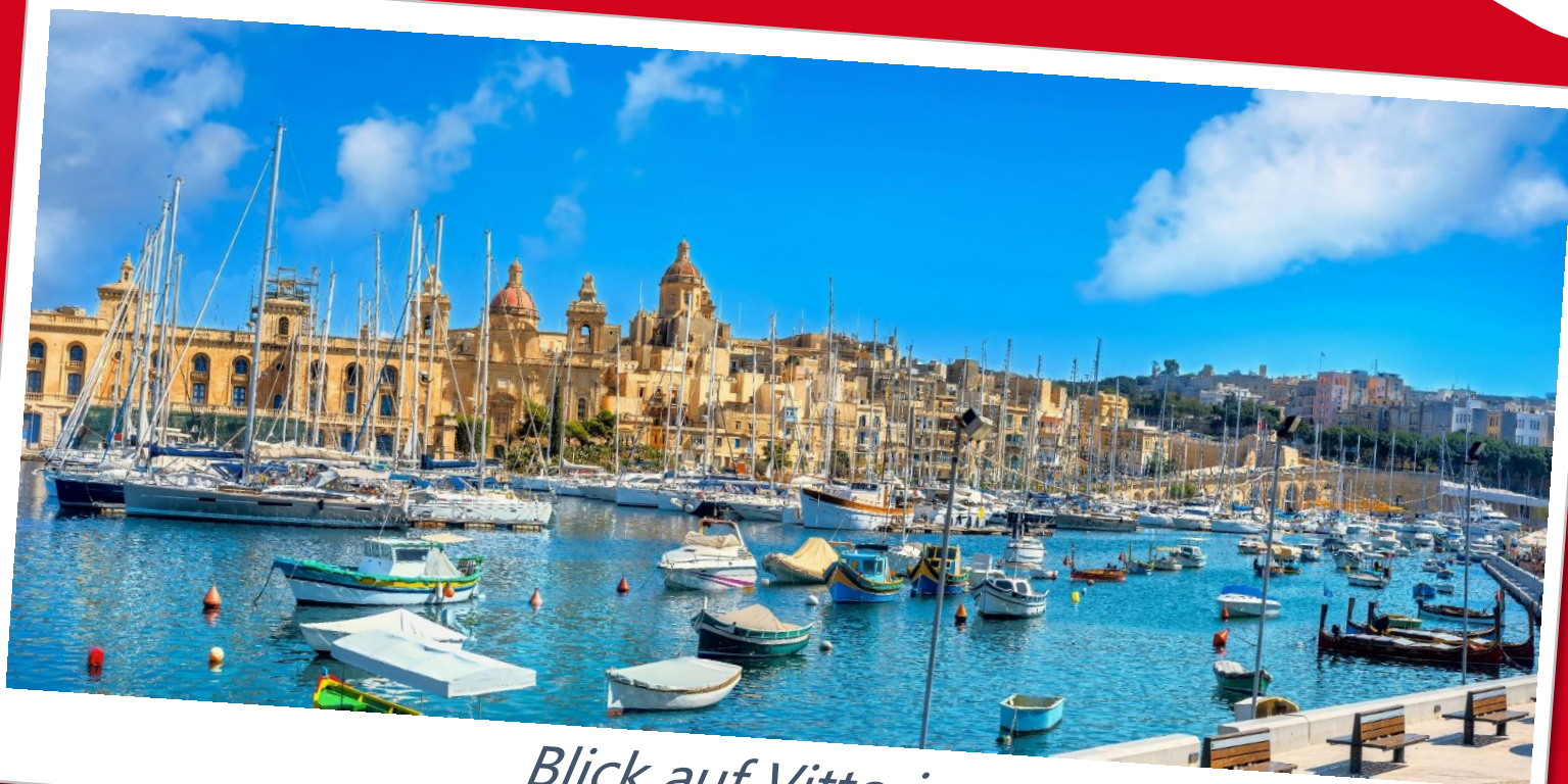
Blick auf Vittoriosa